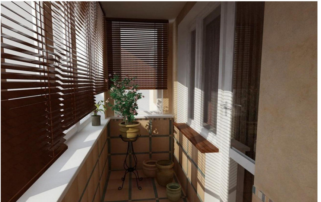
ЛОДЖИЯ – 5 м 2