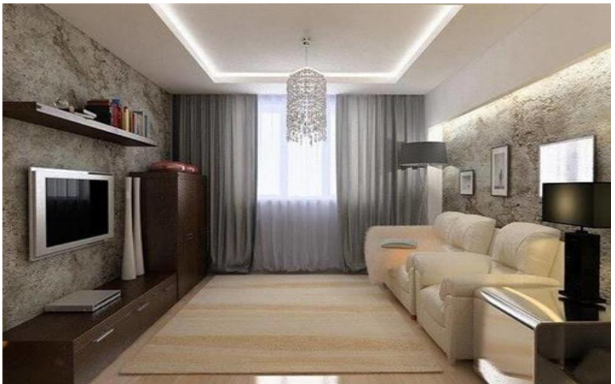
ГОСТИНАЯ – 20 м 2