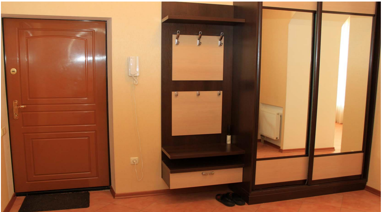
ПРИХОЖАЯ 8 м 2