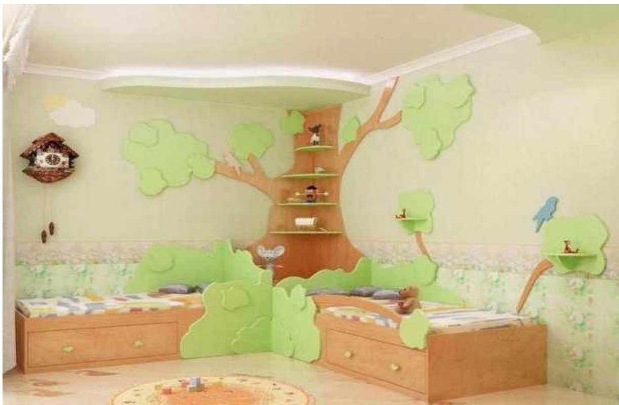
ДЕТСКАЯ - 15 м 2