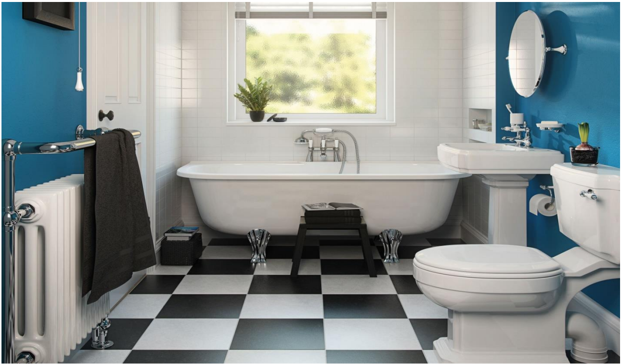
САМУЗЕЛ - 8 м 2