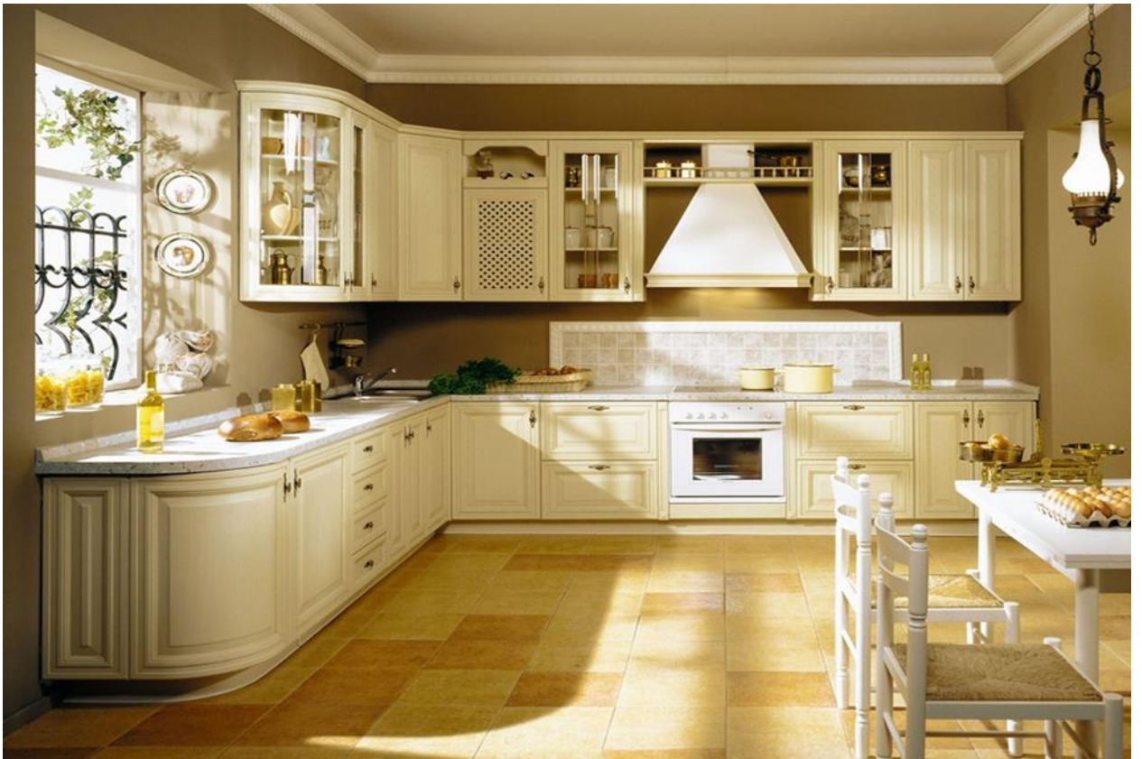
КУХНЯ - 18 м 2