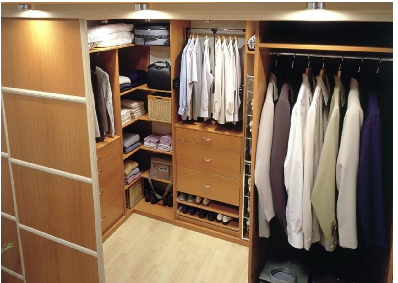
ГАРДЕРОБНАЯ – 5 м 2