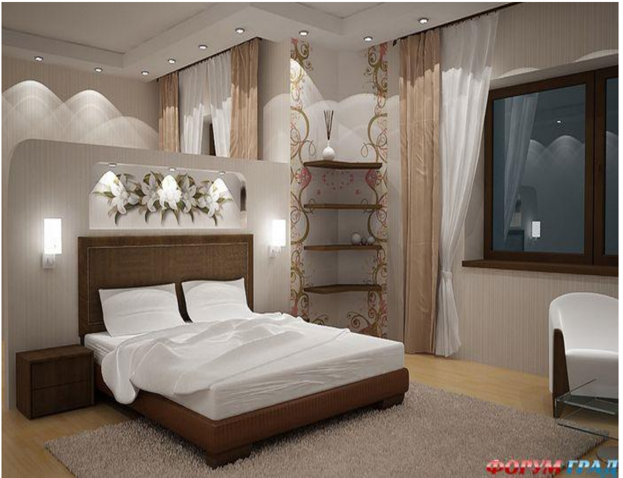
СПАЛЬНЯ - 18 м 2