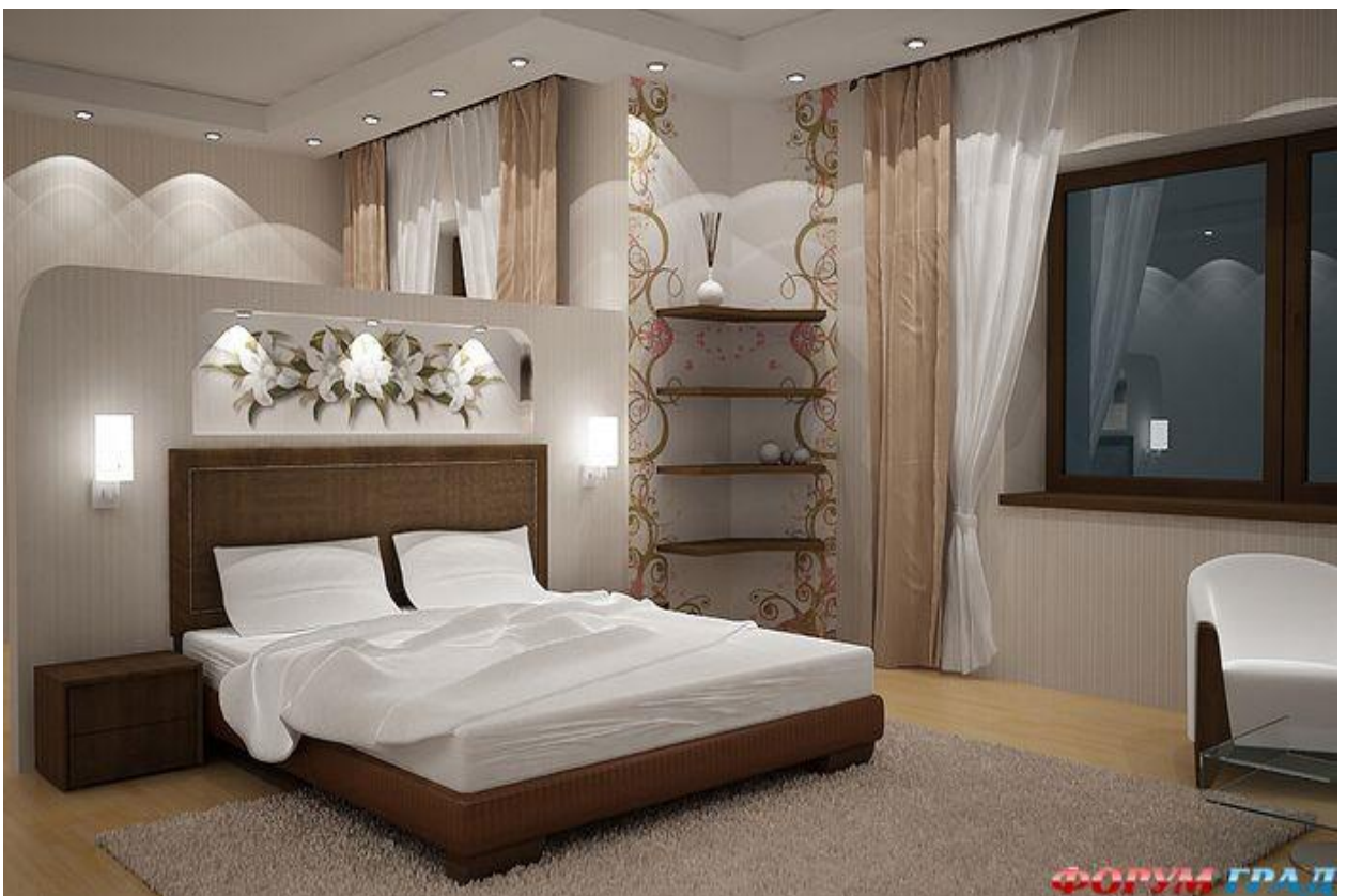
СПАЛЬНЯ – 18 м 2