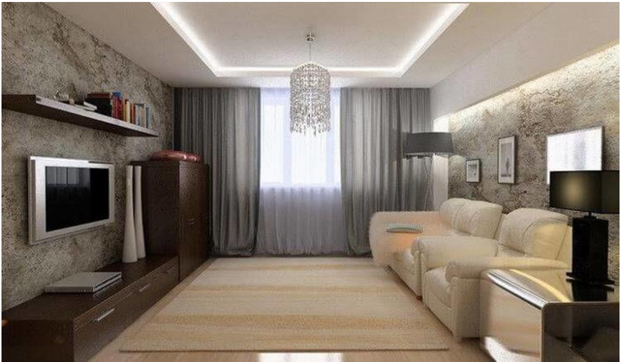
ГОСТИНАЯ – 20 м 2