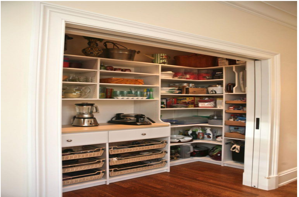
КЛАДОВАЯ – 4 м 2