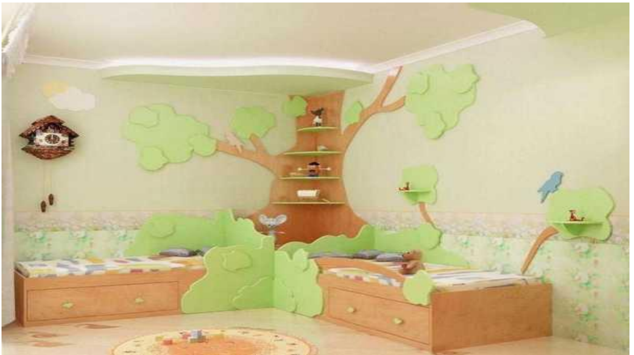
ДЕТСКАЯ - 15 м 2